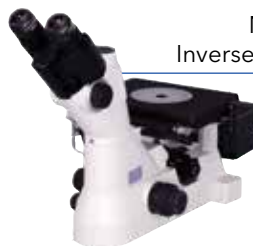
Nikon Inverses Mikroskop