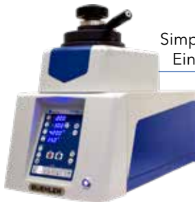
SimpliMet™ 4000 Einbettpresse

Die Einbettpresse SimpliMet 4000 optimiert die Produktivität durch schnelle Einbettzyklen und die Möglichkeit des gleichzeitigen Einbettens von zwei Proben. Hochwertige Einbettmedien gewährleisten gleichbleibende Ergebnisse für Ihre Anwendungen. Unser komplettes Angebot im Bereich der Einbettpressen und -medien finden Sie unter www.buehler.com/mounting.php