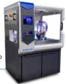
AbrasiMet™ XL Pro Trennmaschine