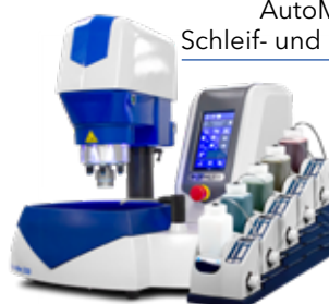
AutoMet™ Schleif- und Poliergerät