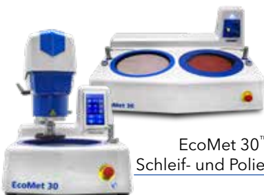
EcoMet 30™ Schleif- und Poliergerät

Buehler führt leistungsstarke, halbautomatische, programmierbare und manuelle Schleif- und Poliergeräte und Planschleifgeräte sowie ein breites Spektrum an Verbrauchsmaterialien für anspruchsvolle Anwendungen. Unser komplettes Angebot im Bereich der Schleif- und Poliergeräte finden www.buehler.com/grinding-polishing.php