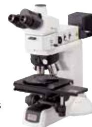
Nikon Aufrechtes Mikroskop

Hochwertige Verbrauchsmaterialien von Buehler optimieren die Probenpräparation und gewährleisten gleichbleibende Präparationsergebnisse. Unser komplettes Angebot an Verbrauchsmaterialien finden Sie unter www.buehler.com