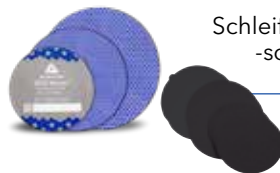
Schleifpapier und -scheiben