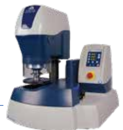
PlanarMet™ 300 Planschleifgerät