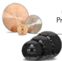
Schleifmittel und Diamant- Präzisionsschleif- blätter