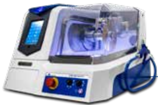
IsoMet™ High Speed Pro

Buehler bietet ein umfassendes Spektrum an Trennmaschinen und Präzisionstrenngeräten, Trennscheiben, Spannvorrichtungen und Kühlmitteln für praktisch jedes Material. Unser komplettes Angebot an Trenngeräten und Zubehör finden Sie unter www.buehler.com/sectioning.php