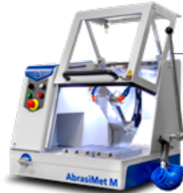
AbrasiMet™ M Trennmaschine