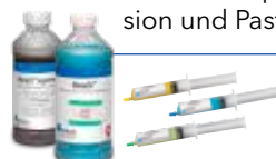
Diamantsuspension und Pasten

Die gesamte Produktlinie finden Sie unter www.buehler-met.de