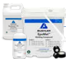
Kalt- und Warmeinbettmittel