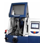
AbrasiMatic® 300 Abrasivtrenn- maschine