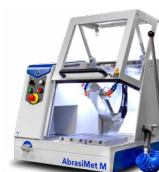
AbrasiMet® M Abrasivtrenn- maschine