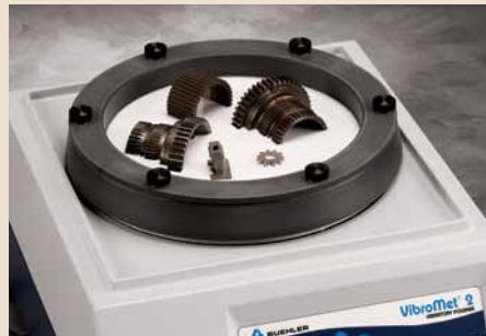
Präparation uneingebetteter Proben

teres Zutun fertig polierte Proben mit exzellenter Oberfläche und hervorragender Randschärfe entstehen. Poliert werden die Proben mit oxidischen Poliersuspensionen wie MasterPrep, MicroPolish oder MasterMet. Vibrationspolieren eignet sich besonders für die Präparation empfindlicher Materialien und weicher Werkstoffe. So können z.B. extrem weiche Werkstoffe wie reinsten Edelmetalle oder Materialien, die zur Bildung von Schmierschichten neigen, mittels Vibrationspolitur mühelos poliert werden, ohne dass das Gefüge durch eingedrückte Partikel oder zu starkes Relief verfälscht wird. Oberflächen, die mit VibroMet 2 präpariert wurden sind praktisch verformungsfrei. Daher eignen sich die Proben besonders zur EBSD-Untersuchung (Elektronenrückstreuung).