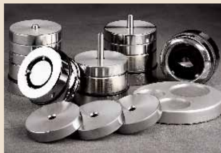
Probenhalter und Gewichte zum VibroMet 2