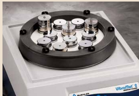
Präparation von Proben im Halter mit Gewichten